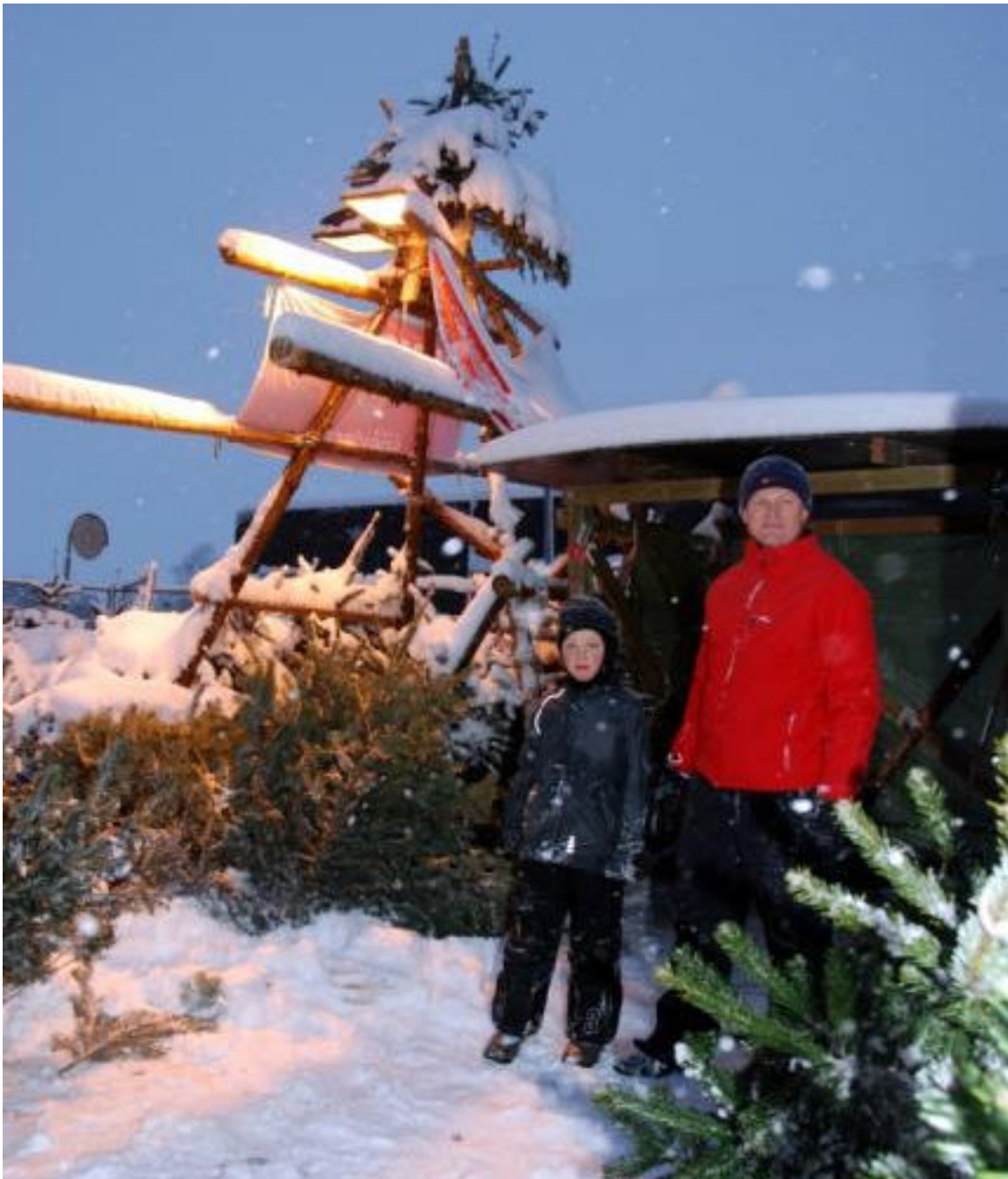
Juletræssælgere i snevejr