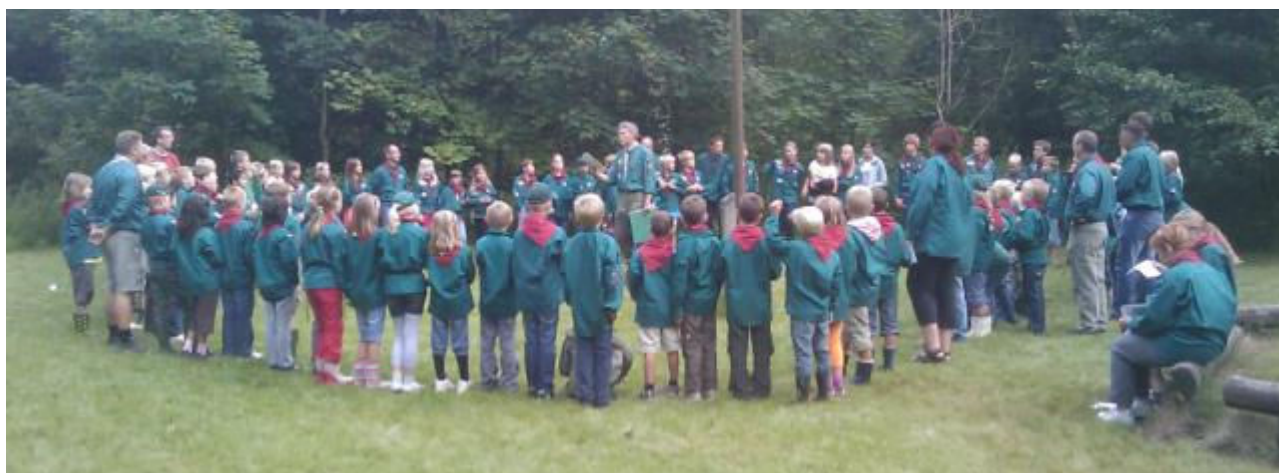
Fælles opstart i august 2009