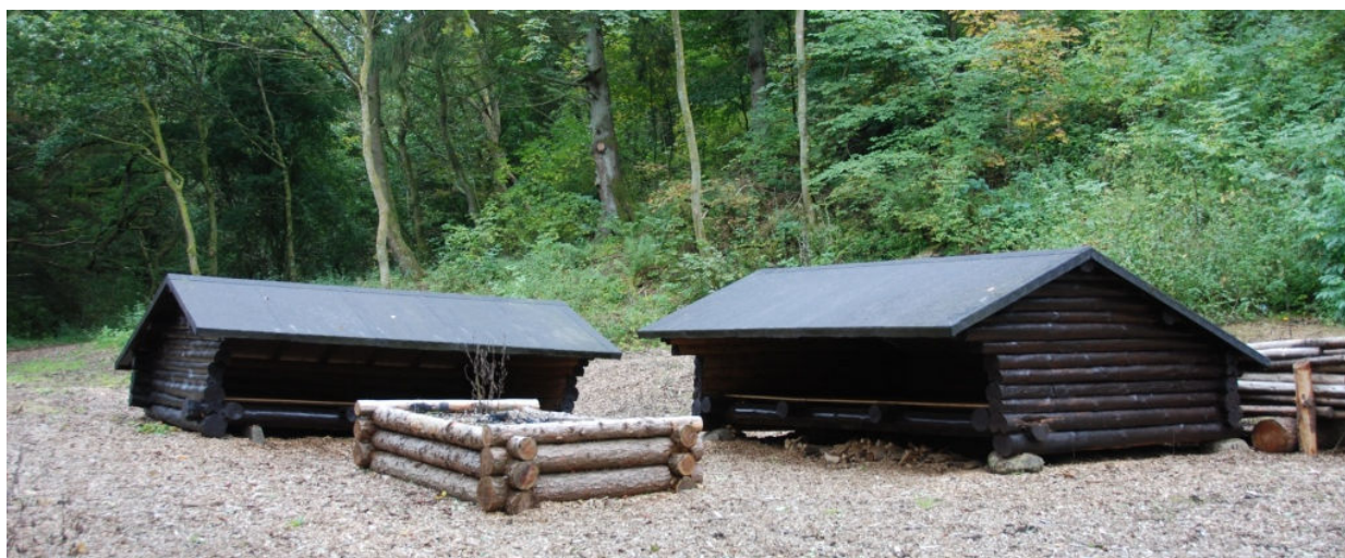
Shelters ved Vork Spejdercenter