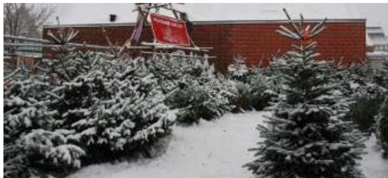
Juletræer pyntet med sne ( - og ekstra arbejde)

Juletræssalget bød på flere nyheder i år. Dels solgte vi 50 træer til Nykredit på gavekort, som deres kunder så kunne komme og indløse mod et træ efter eget valg. Det gav en fin omsætning og en god omtale af vores juletræssalg, da en del af Nykredits kunder kom fra områder uden for vort normale salgsdistrikt.