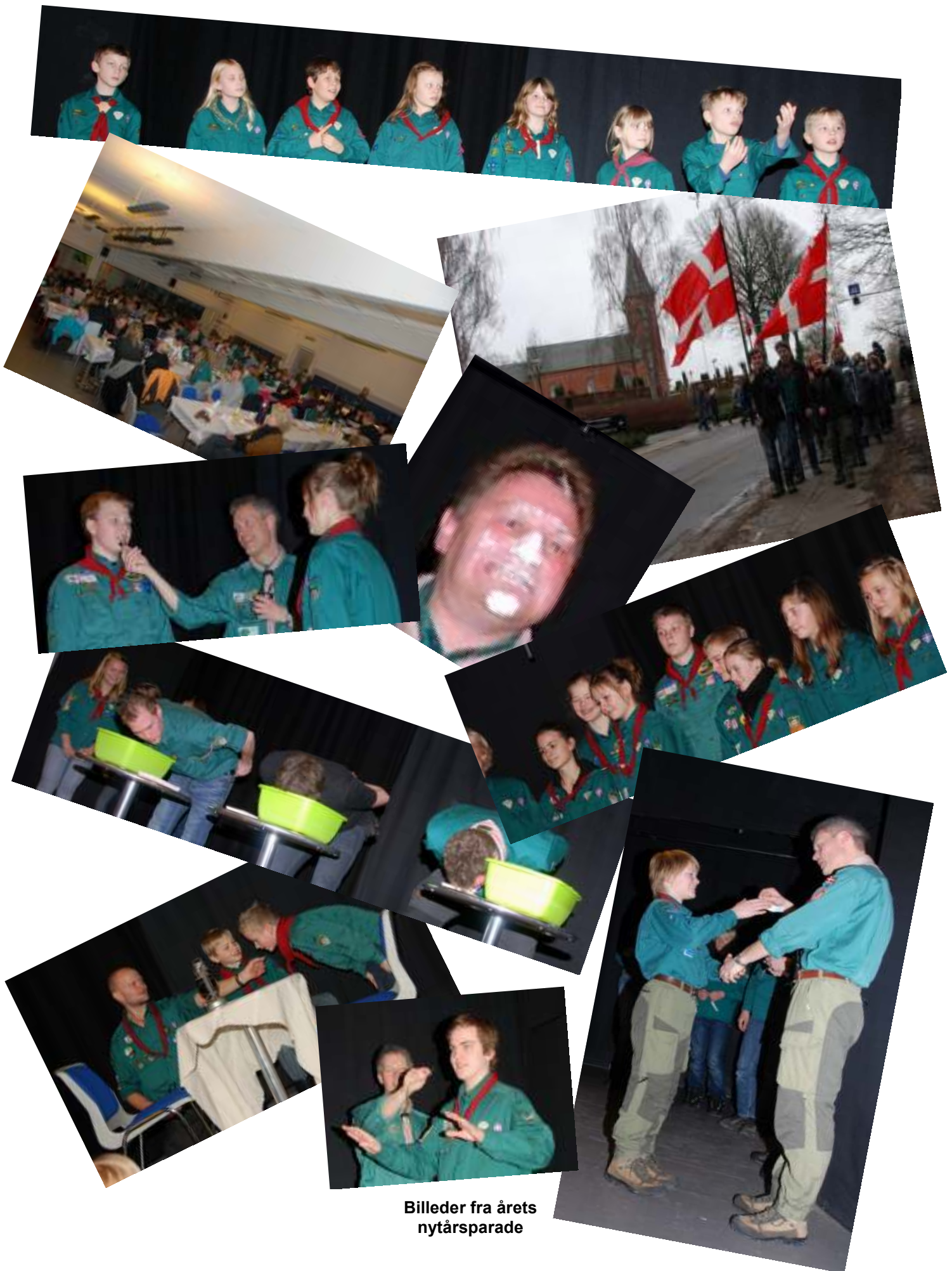
Billeder fra årets nytårsparade