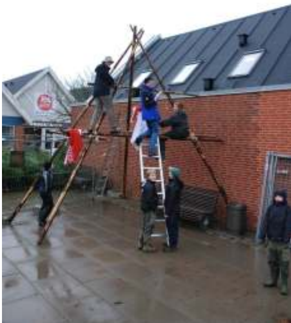
Spejderne bygger tårnet ved juletræssalget

Jeg er ret sikker på, at de af forældrene, der har stået og solgt træer i hård frost og blæsevejr, ved hvad jeg mener, når jeg skriver til sælgerne, at varmt tøj er en god idé, for det kan være koldt.