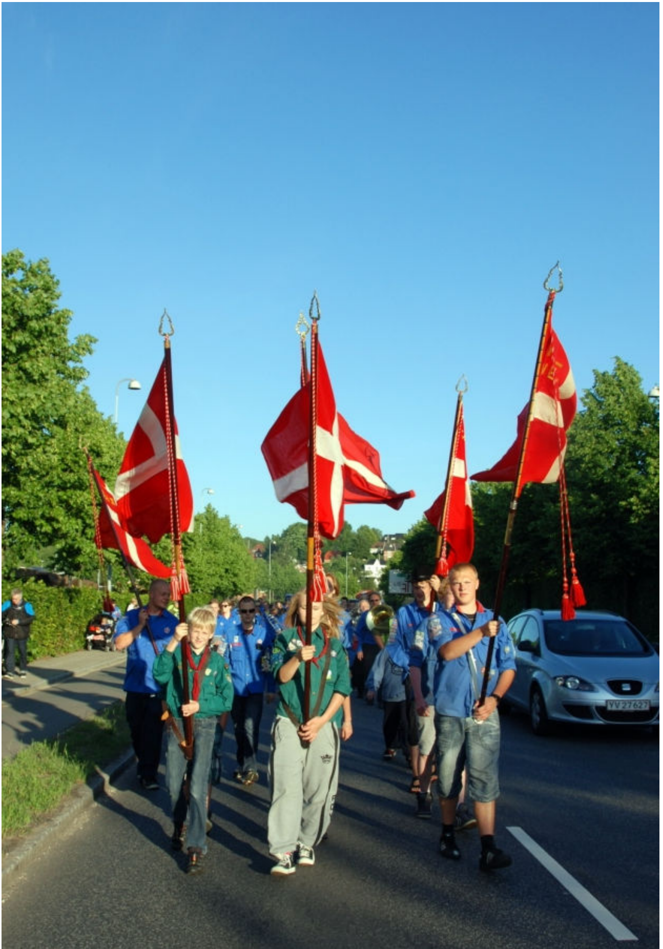
Fanebærerne fra Grydefesten i juni