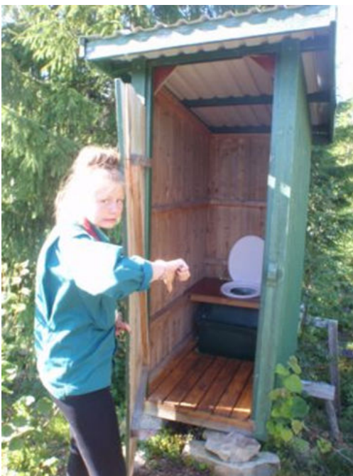
Toiletterne var ikke ligefrem noget at juble over - rent faktisk var det bare et hul i jorden med et toiletbræt ovenpå. Lugten var dog det værste!!!