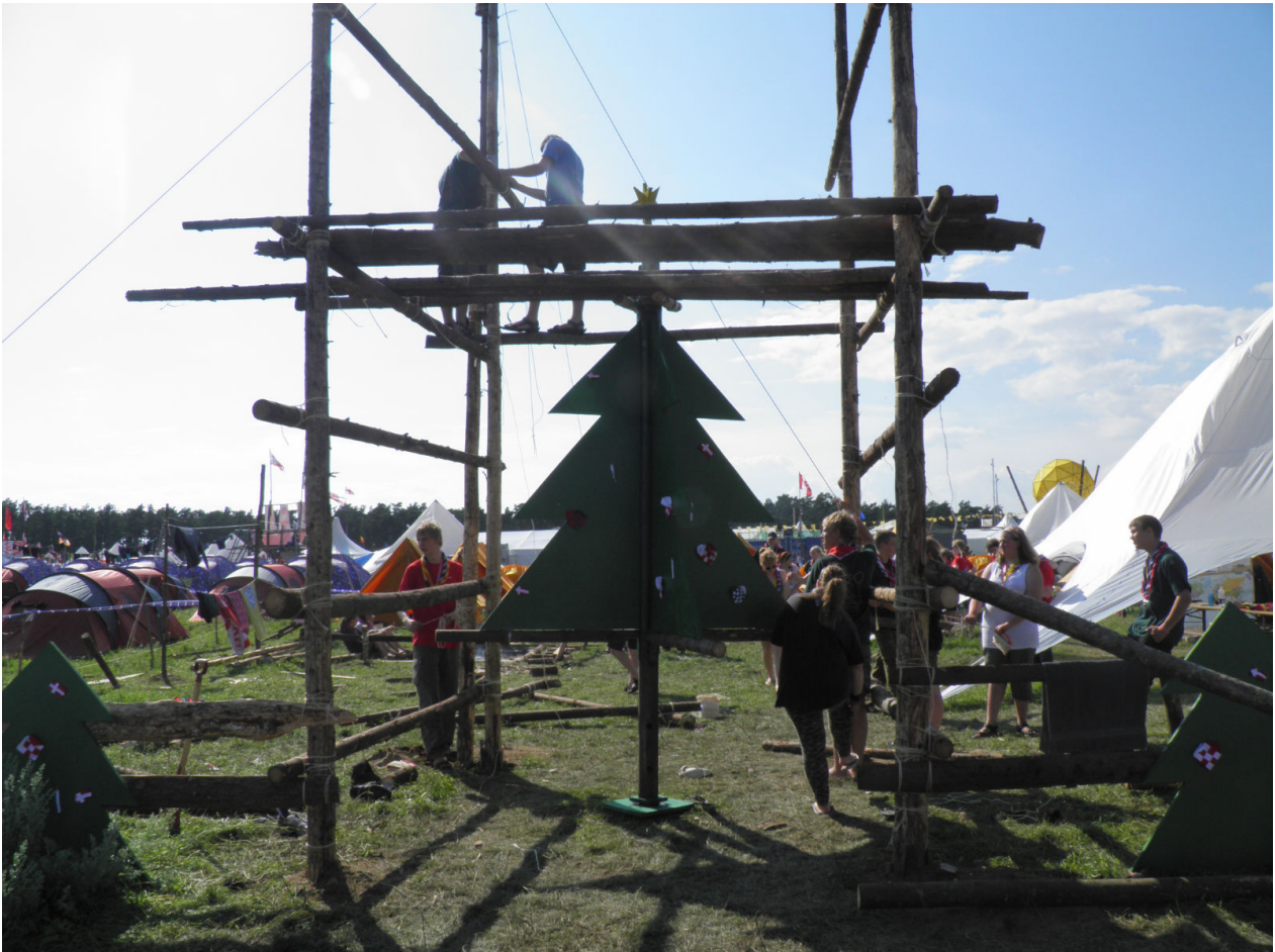
Indgangsportal designet som et juletræ

texansk mad og opleve traditionel folkedans fra Libanon. Samme aften var der Culture Festival Ceremony, hvor der sådan set kun var en masse småforestillinger. Blandt andet et BMX show og otte-ti faldskærmsudspringere, hvor flyet de hoppede ud fra lige tog et drej, så den fløj lige over alle deltagerne.