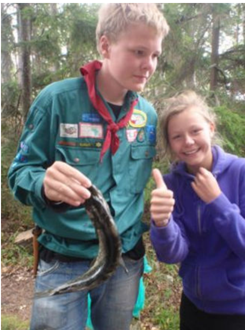
Så er der fanget fisk!