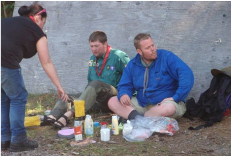
Så er der frokost til lederne!