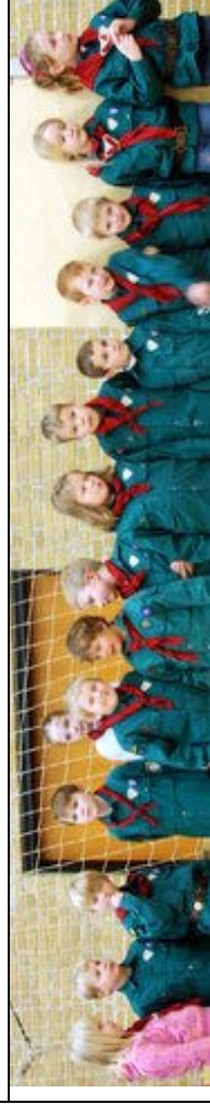
Spejdernes nytårsparade i Kirkebakkehallen