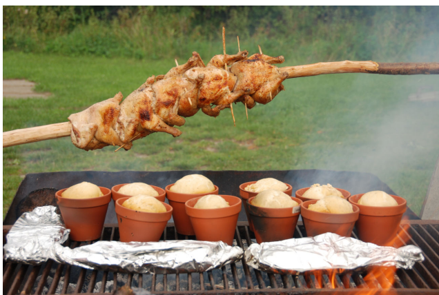
Kyllinger, brød og fisk i folie over bålet.

Programmet for weekenden stor på mad over bål. Der blev stegt fisk, bagt brød i urtepotter, grillet kylling over bål samt stegt lammekølle og lavet bagekartofler i en grube.