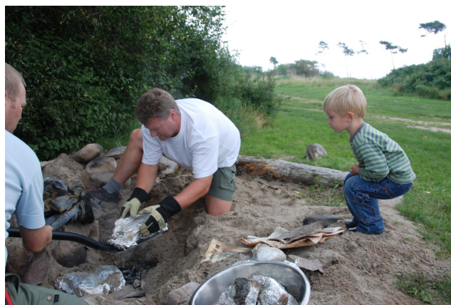
Kartofler og lammekøller graves op ad gruben efter at have ligget begravet i nogle timer. En repræsentant for næste generation inspicerer.

Lammekøllerne var i øvrigt krydret med de urter, vi kunne finde på Torø – blandt andet brændenælder.