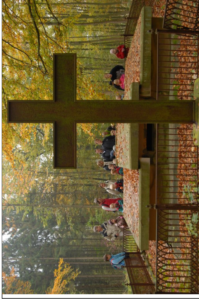
Bævernes 10 km. vandretur i Storskoven ved Tirsbæk. Billedet er fra slotsfamiliens gravplads