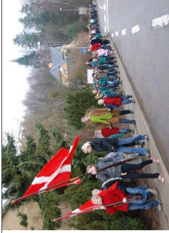
Faneoptog fra spejdernes nytårsparade i januar